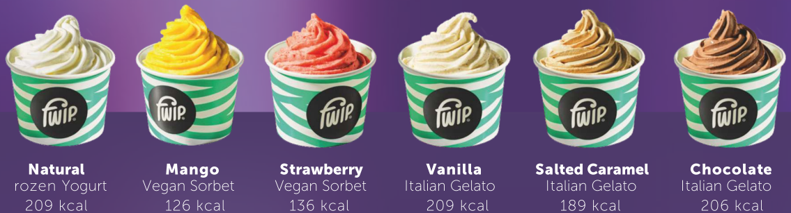
Natural rozen Yogurt 209 kcal