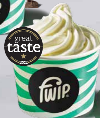
Natural Frozen Yogurt 174 kcal 2 (S) (M)