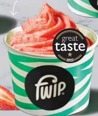
Strawberry Vegan Sorbet 136 kcal 2