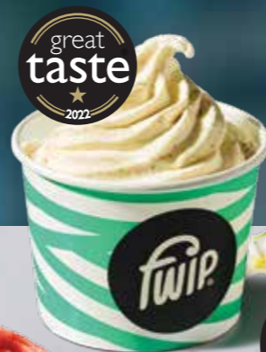
Vanilla Gelato 210 kcal 2 (S) (M)