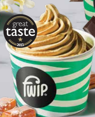
Salted Caramel Gelato 189 kcal 2 (S) (M)