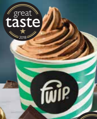
Chocolate Gelato 206 kcal 2 (S) (M)